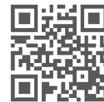
Código QR de acceso a KLHdesigner