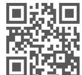
Código QR de acceso al sitio web